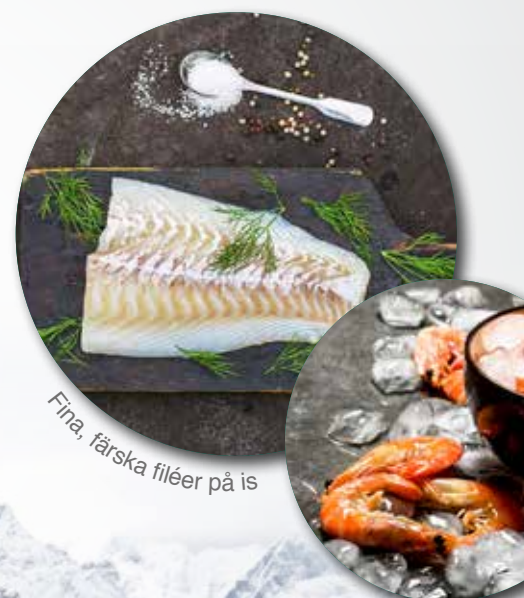
Fina, färska filéer på is

"Varför ska det vara så svårt att få tag på färsk fisk av hög kvalitet till vettiga priser i Sverige?" undrade vår norska farmor. Självlärt borde även svenskarna få äta bra, färsk och smakfull fisk. Därför grundade vi fyra bröder företaget Frisk Fisk. Vår affärsidé är att varje svenskt hushåll ska kunna äta frisk fisk av absolut högsta kvalitet till fördelaktiga priser. MUMS!