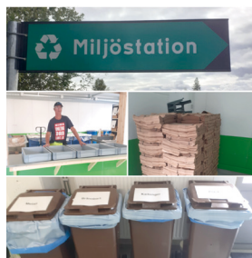
Person på bilden Torbjörn Risberg, GS

Bjurholms nya miljöstation finns på Industrivägen 5, bakom fastigheten följ skyltarna. Miljöstationen är öppen onsdagar kl.12.15-15.00.